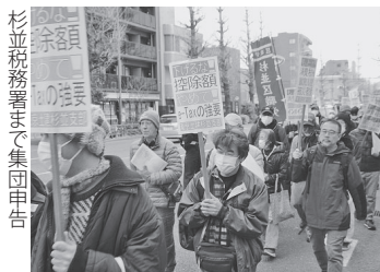
支部会館で初めて集会を開催