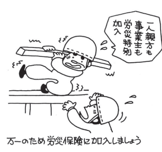
万のため労災保険に加入しましょう

既加入者には個別に案内を郵送しますので、お送りした用紙に必要事項を記入し、支部にて保険料をお納めください(新規加入は随時受付中)。