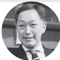
早坂よしひろ都議【自民党】