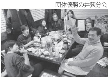
団体優勝の井荻分会

1月29日(日)午後3時に狹窪ボウルへ集合し、分会対抗ボウリング大会を開催しました。全8分会から大人50人、子ども8人が集まりました。