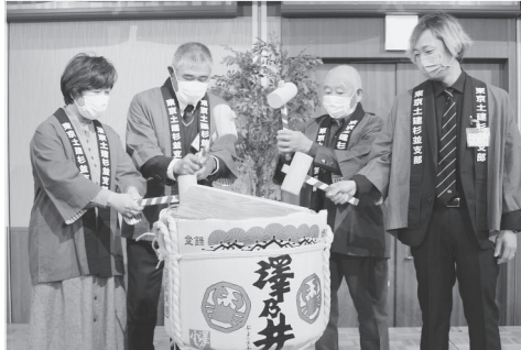
まつば多美子都議【公明党】