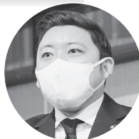
関口健太郎都議【立憲民主党】