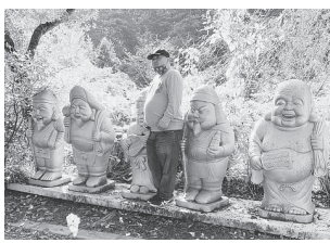
布袋さんの中に仲間が