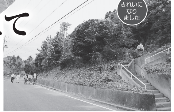
きれいになりました