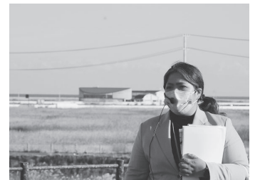
語り部さんの背後が請戸小学校

11月19日(土)から20日(日)にかけての被災地支援活動に杉並14人・新宿4人・文京3人の3支部21人が参加しました。初日の19日は視察が中心。双葉町の東日本大震災・原子力災害伝承館を見学し、語り部さんから話を聞きながら約1時間のフィールドワーク。宿泊は相馬市・蒲庭温泉の蒲庭館でした。