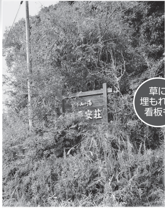
草に埋もれた看板も