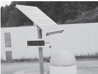
まだ高線量の仮置場(南相馬市小高区)