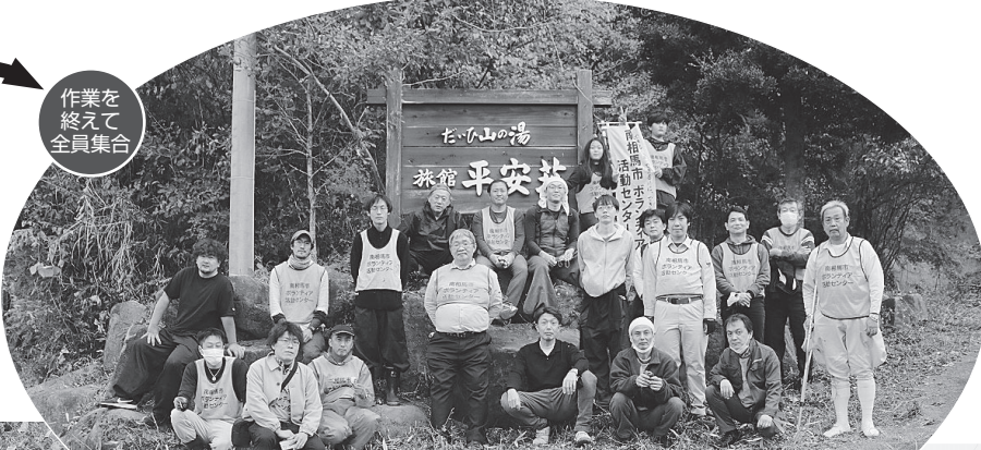
作業を終えて全員集合