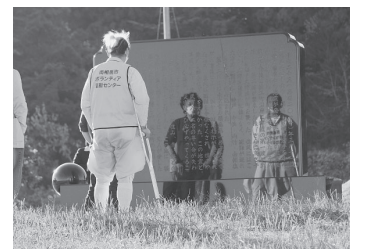
石碑を読む仲間たち

展示が並んでいます。事故の主因である津波・地震による電源喪失を防ぐ機会があったことは明示されています。解説員さんは原発サイトの模型の前で、2点説明していました。①内陸で竜巻に備えて発電機などを地上ではなく地下に設置したアメリカの設計をそのまま日本に導入。②1、4号機と比べ5・6号機は