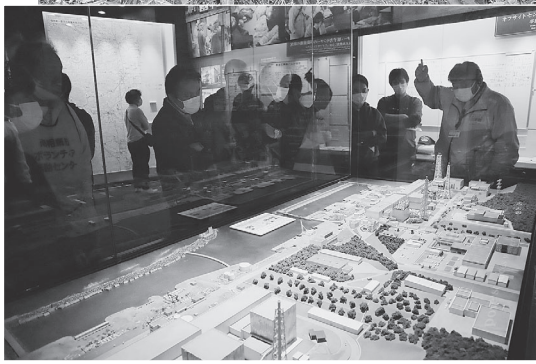
原発サイトの模型前で解説を聞く仲間たち(伝承館)