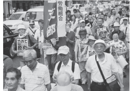
2011年9月のさようなら原発集会

自公両党が合意した敵基地攻撃能力保有の特徴は①攻撃が実行される前でも、相手が攻撃を企図した場合こちらから攻撃できる(相手に撃たれる前に撃てる)②日本が攻撃される(米軍)がなくても米軍(米軍)が攻撃されそうになったら撃てる③相手の基地に限らず指揮命令系統のあるところを攻撃できるとしています。