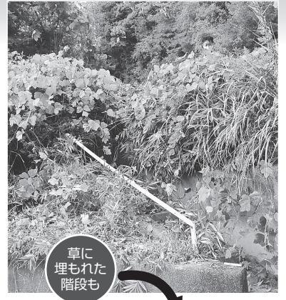
草に埋もれた階段も