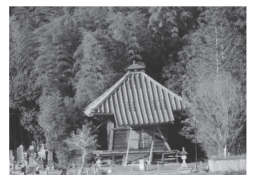
傾いたお堂も修理できず