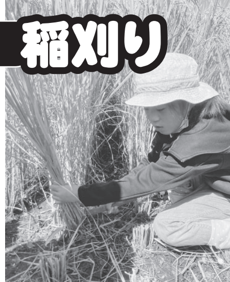
しっかりと稲をつかんで刈り取り