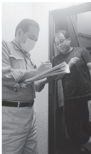
お困りごとないですか? 訪問して聞き取り中

共済・国保・仕事・くらし... 助け合いの力拡大を 組合では病気やケガで働けない時の共済や国保の給付、労災申請などのほか、仕事に役立つ学習や資格講習、建設キャリアアップシステムの登録や不払いなどの相談などもおこなっています。 「コロナ第七波で組合員が感染し共済・国保の給付を受けている方も多いため、陽性判定を受けて仕事ができず収入がなかった方は、至急支部までご連絡ください。」「コロナにかかったという仲間がいたら「共済や国保が出るかも」と支部への連絡をぜひお願いします。」 こうした助け合いの制度をつくり運営できているのは仲間の皆さんの数と団結の力です。仲間が増えれば東京土建はもっと良くなります。今月末までの拡大月間にも協力ください。