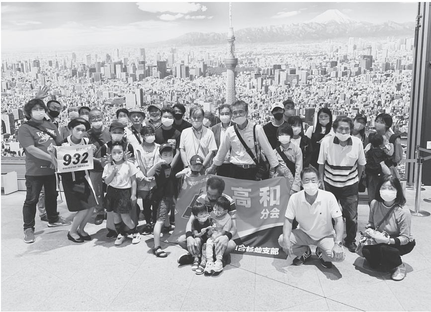
スカイツリーで記念撮影