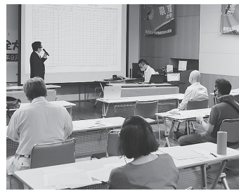
室岡安全衛生課長の話聞き学ぶ