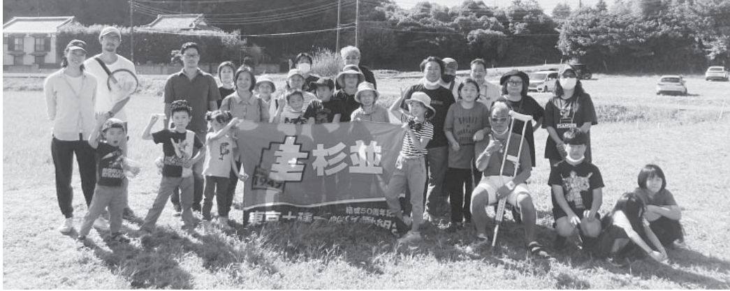
参加した杉並支部の仲間たち