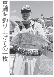
真鯛を釣り上げての一枚