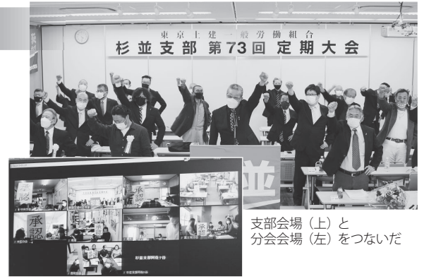
支部会場(上)と 分会会場(左)をつないだ