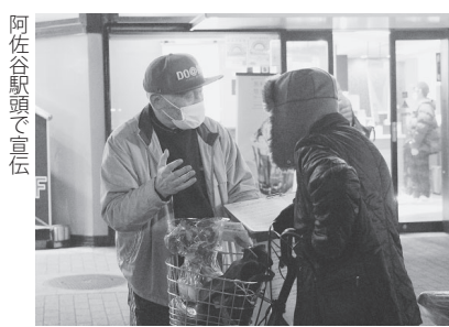
阿佐谷駅前で宣伝