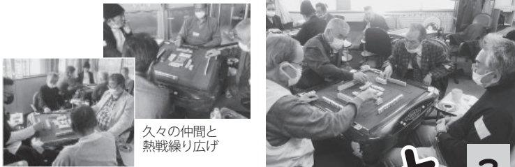
久々の仲間と熱戦繰り広げ