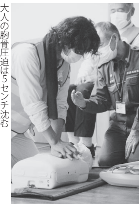
大人の胸骨圧迫は5センチ沈む