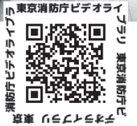
東京消防庁ビデオライブラリー 東京消防庁ビデオライブラリー 東京消防庁ビデオライブラリー