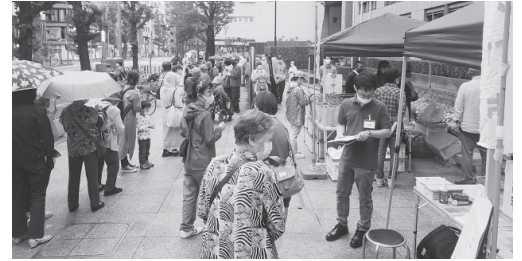
▲区役所前での食料配布

約9年の現政権でくらしはよくなりましたか。数を頼みに国会を形骸化し、人事で官僚を支配し、トモダチ優遇、権力を縛る憲法を壊し、外国勢力に国を売り渡す政治から脱却できるか。総選挙は文字通り国民と国家の命運をかけた決戦です。棄権は現政権容認、白紙委任状と同じ。必ず投票に行きましょう。