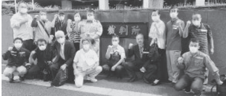
裁判所前で勝利誓う