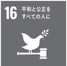
16 平和と公正を すべての人に

持続可能な社会めざして⑤ 平和、公正でしっかりした機関 すべての人が平和と豊かさを享受できることをめ ざし国連の定めた「持続可能な開発目標」は17の大 目標を設定しています。 平和、公正でしっかりした機関を確立するのこそ のひとつです。 武力衝突や、危険なまち、ま 待、搾取、取引、暴力を撲滅す る③国家・国際規模で法の支配 を広げ、すべての人々に司法へ の平等なアクセスを提供する 100人が武力衝突で殺され ています。人権保障の入口とな る、出生の登録すらできない人 も多数いるのです。 世界の5歳以下の子どもの 出生登録率は73%、アフリカの 一部では46%に過ぎ ず、世界全体では2、 850万人もの就学 年齢の子が学校へ行 けない状況にありま す。 この状況は持続可 能な社会とは相いれません。平 和の実現、そのためには賄賂や 利権にまみれることなく公正 な機関の確立が大切である、と いうのが目標16です。 この目標の11のターゲット の一部を紹介すると①暴力 に関連する死亡率を大幅に減 少させる②子どもに対する虐 目み締めたいことです。 「平和」の一番の脅威である 戦争を起ささないのはもちろ ん、その火種を消していくため には、個人個人の努力はさるこ とながら、機関を確立していく のが必要だ、という点も改めて 噛み締めたいことです。 この状況は持続可 能な社会とは相いれません。平 和の実現、そのためには賄賂や 利権にまみれることなく公正 な機関の確立が大切である、と いうのが目標16です。 この目標の11のターゲット の一部を紹介すると①暴力 に関連する死亡率を大幅に減 少させる②子どもに対する虐 目み締めたいことです。