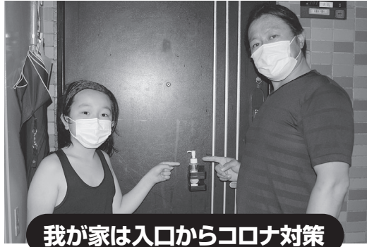
我が家は入口からコロナ対策