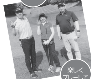
楽しくプレーして