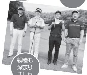
親睦も深まりました

6月3日、杉並支部は事業所交流会&球遊会によるみんなのゴルフコンペを17人の参加でおこないました。埼玉県深谷市の岡部チサンに集合し朝9時から4組に分かれてプレー開始。最近梅雨かと思ってしまう雨続き