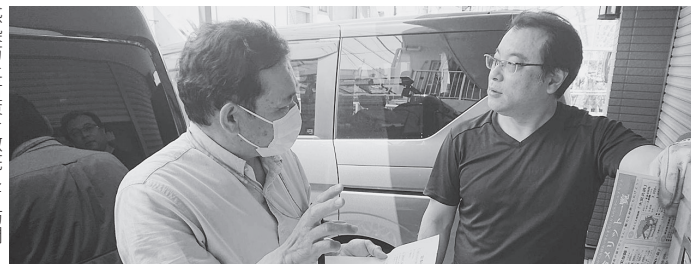
感染防止対策を徹底して訪問

これはひとえにコロナ緊急事態宣言下で活動にも大きな制約を受け、また仕事の減少や私生活上も多くの困難を抱えるなかでも、感染対策に配慮しながら行動を重ねて多くの仲間を迎え入れたみなさんのご協力・ご奮闘のおかげです。心から感謝申し上げます。