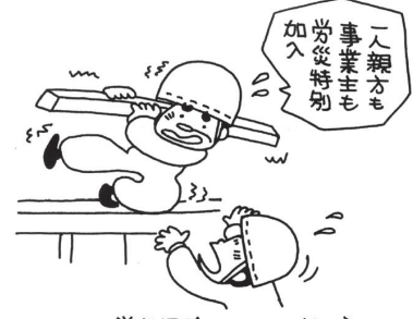
万-のため労災保険に加入しましょう

既加入者には個別に案内を郵送しますので、お送りした用紙に必要事項を記入し、支部にて保険料の納入をお願いします。(新規加入は随時受付中)