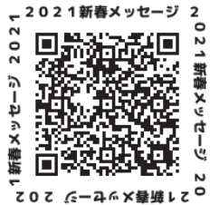
2021新春メッセージ 2021年新春メッセージ 2021年新春メッセージ

1月17日に予定していた支部新春旗開きは新型コロナウイルスの感染拡大を少しでも食い止めるため中止しました。執行委員長からの新春あいさつを掲載します。また、田中良杉並区長をはじめ多くの方からも新春メッセージをいただき、ホームページに掲載してつよのびを願う予定です。