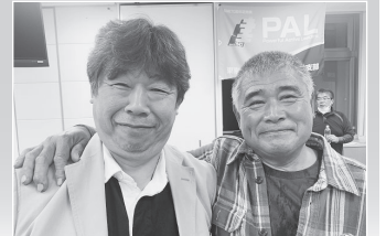
角田組織部長と鎧田執行委員長