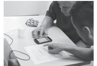
わからないことがあれば組合へご相談を

着工前の調査・報告 工事の規模にかかわらず、事前調査は全ての工事が対象となったおり、一定規模(解体80㎡・改修100万円)以上の工事は、元請業者が労働基準監督署と都道府県に対して、事前調査結果の報告をあらかじめおこなう必要があります。 アスベスト事前調査の報告を怠ると、大気汚染防止法に基づき、30万円以下の罰金に科