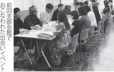
前回支部会館で おこなわれた出会いイベント

「現場と自宅の往復で出会いがない」とお嘆きのあなたに朗報! 杉並支部出会いイベント復活のお知らせです。参加資格は50歳程度までの独身組合員。