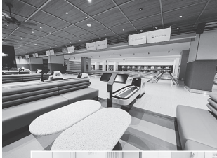
昨年10月オープンの おしゃれな会場