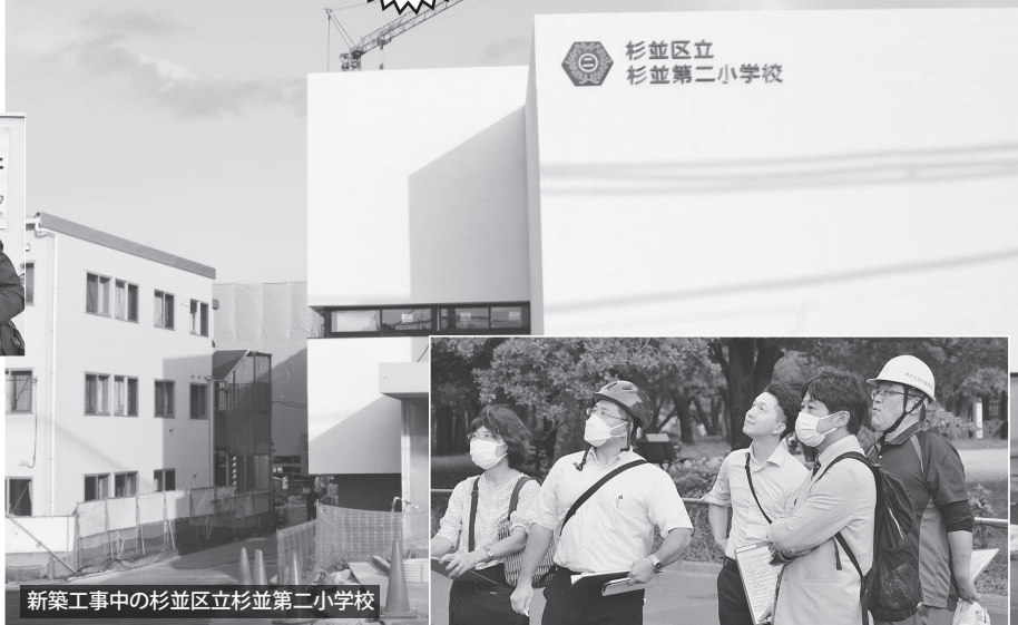
新築工事中の杉並区立杉並第二小学校