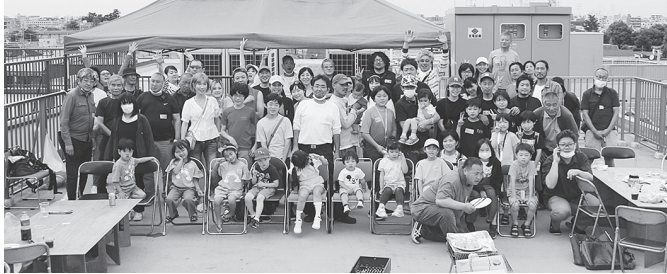
5/28開催の支部会館屋上BBQ

夏の暑さも和らぐ頃、気持ちの良い季節になります。後継者対策部主催で支部会館屋上バーベキューを開催します。秋空を眺めながら、仲間と笑い、語り合いませんか？