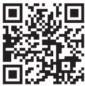
ものづくり・匠の技の祭典 2023ホームページ