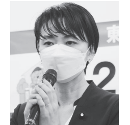
吉田はるみ・衆議院議員(立憲民主党)