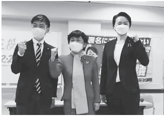
3人は憲法審査会の委員