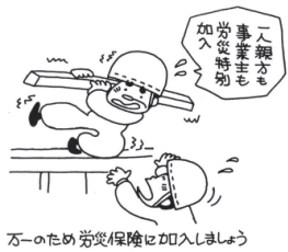
万一のため 労災保険に加入しましょう

①求職者給付 失業・求職期間中に給付を受けられます。給料・年齢・離職理由により異なりますが、最高で月25万円程度。 ②育児休業給付 最長で子が2歳になるまで。 ③雇用調整助成金やコロナ対応休業支援金・