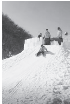
雪の滑り台も楽しめました

2月25日夜発、27日夕方帰り、後継者対策部主催のスキー・スノボツアーを19人の参加でおこないました。今回訪れたのはスノーパーク尾瀬戸倉スキー場。直前に抗原検査キットでの陰性確認もしてコロナ対策もばっちりです。2日とも好天にめぐまれ、初めて顔をあわせた子どもたちも雪遊びですっかり仲良しに。みなさん久しぶりのイベントを楽しんでいました。