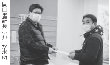
関口書記長(左)が来所

フリーランスの言葉で偽装的な業務委託の広がりや許さないためにも世論の力で彼らのたたかいを支援しましょう。