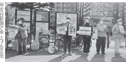
阿佐谷駅前で声上げる市民