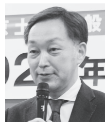
早坂よしひろ・都議(自民党)