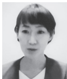
あかねがくぼかよ子・都議(都民ファースト)