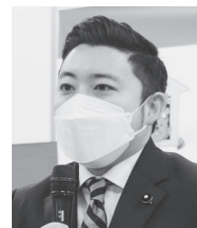
関口健太郎・都議(立憲民主党)