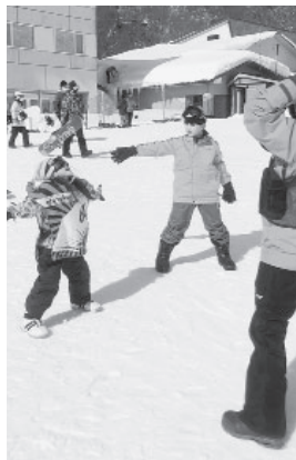
準備運動はしっかりと